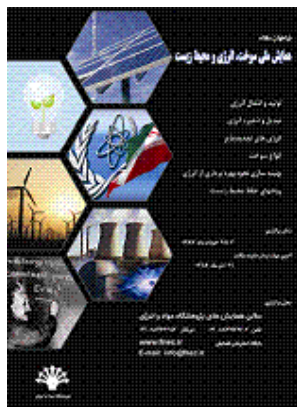
شکل ۱- نمونه شکل داده شده